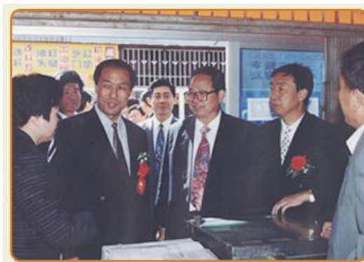
原河北省副省长郭红岐在庞口市场调研