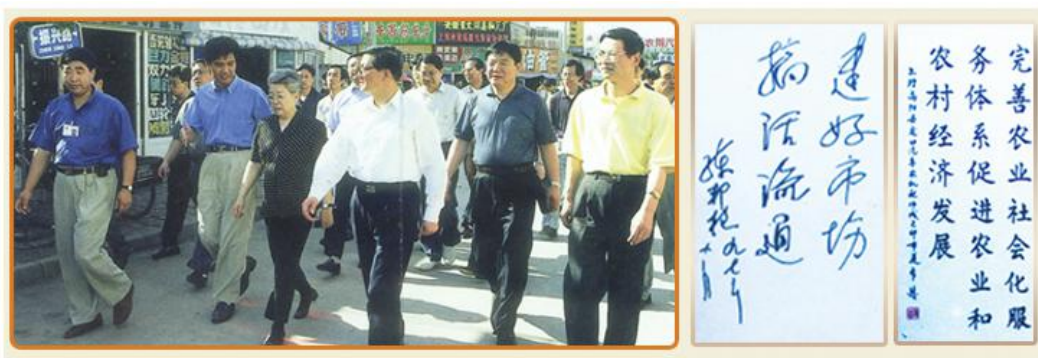
1999年6月23日，中共中央政治局委员、国务委员吴仪在河北省省长钮茂生、保定市长付志方等领导陪同下，考察庞口汽车农机配件城。

伴随着改革开放的春风，庞口诞生出全国最大的农机配件交易市场。在市场的兴起和发展过程中，得到了国家、省、市及行业主管部门领导的关怀和指导，也获得了一系列的荣誉。庞口，正在继续抒写着一页又一页发展的篇章。