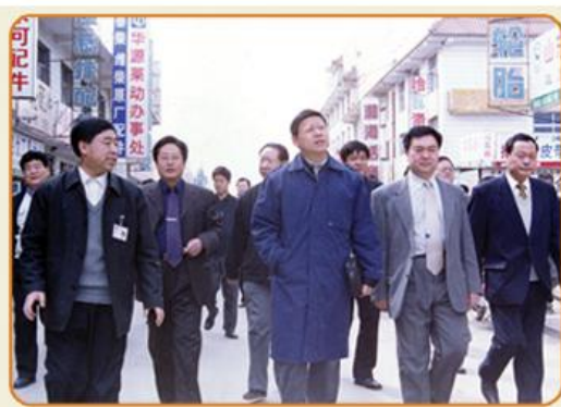
原农业部副部长范小健在庞口市场调研